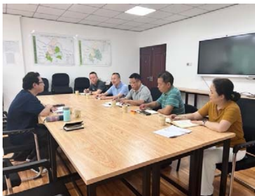
他環境NGOとの意見交換