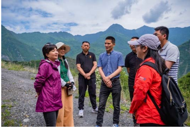
ガンブ村で関係者と協議