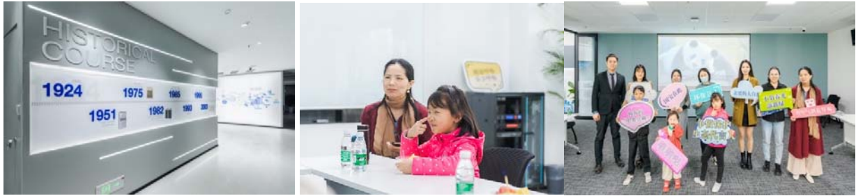
ダイキン中国の展示場にて実施されたジャイアントパンダ学習コース

2022年3月27日、ダイキン中国が成都に新設した展示場で、家族向けのジャイアントパンダ学習コースが開催されました。このコースはダイキン中国とCI中国が共催し、ジャイアントパンダの専門家と一緒にパンダの進化から生育、生活、パンダ同士の関係性、人間社会との共生について学び、コース終了時には参加者にジャイアントパンダグッズが贈られました。この展示場では、ダイキン中国のスタッフがダイキンや空調機の紹介を行っています。