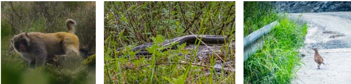
ガンブ村サイトで見られた野生動物たち（左から、アカゲザル、スジオナメラ、コウライキジ）