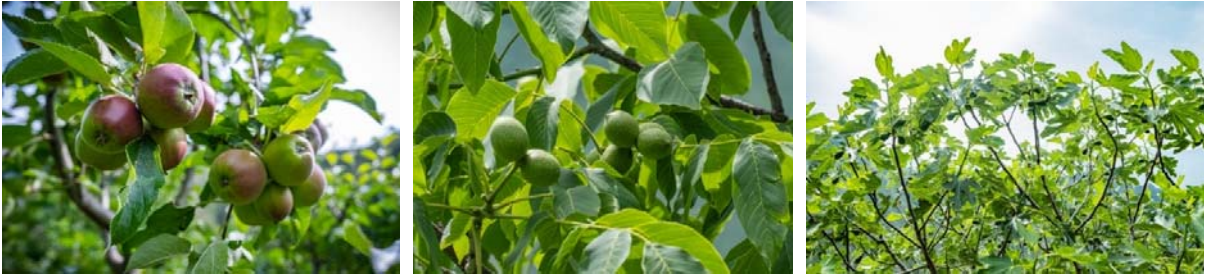
果樹園の様子（左から、リンゴ、イチジク、クルミ）