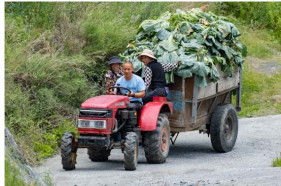
(左) キャベツ収穫の様子、(右) 生野菜はチベット豚の飼料にもなります