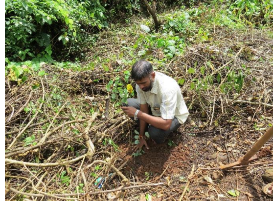
Kulye の聖なる森の空き地に自生種の苗を植え付け