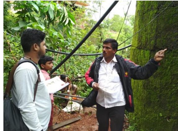
Ambavali 村でのかまどの実演と村長との話し合い