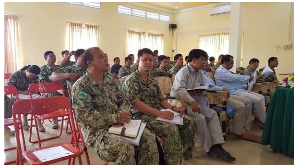
自然保護区法、法定文書、記録手続き、国家資源犯罪に関する訴訟書類の編集に関する研修に参加したレンジャーたち