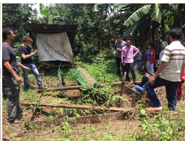
Bodia 社の代表がレモングラスオイルから作られた製品を紹介し、オイル抽出機を設置する予定の Tatay Leu 村内の場所を調査