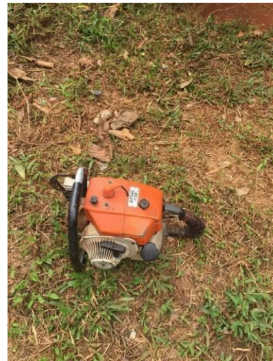
中央カルダモン国立公園で押収されたローズウッドの木材とチェーンソー