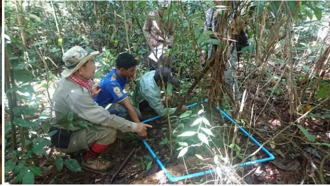
トレーニングを受ける住民とレンジャー 監視サイトにおける基礎調査トレーニング