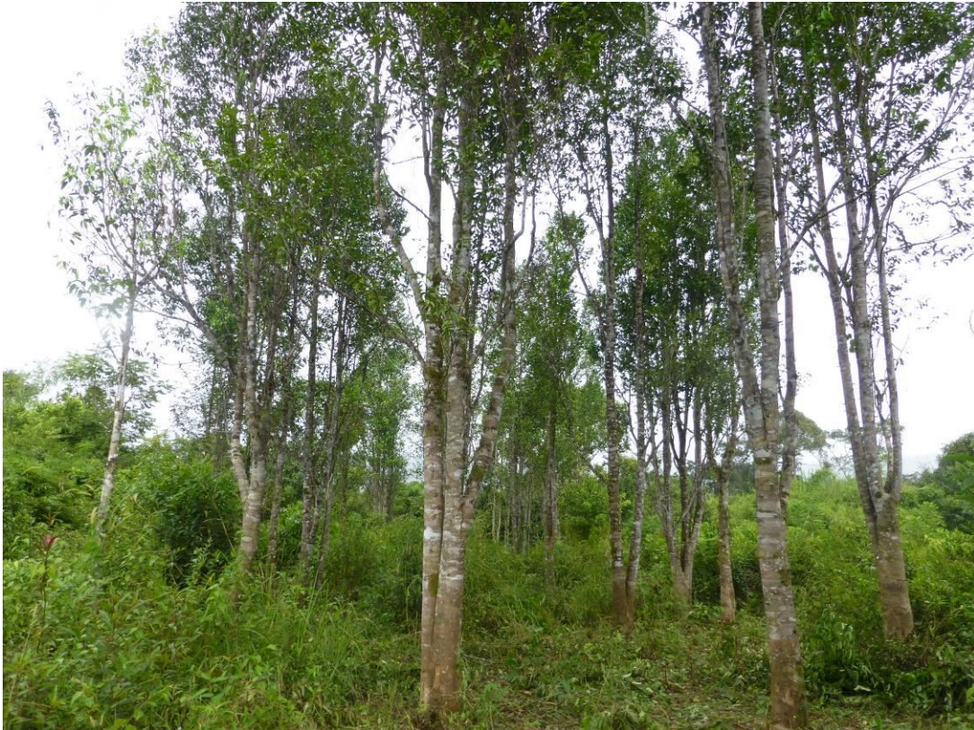
Thmo Don Pov 村にある実験サイトのアガーウッドの木々

8月から10月にかけて、環境省と協力してパトロールと違法行為の取り締まりを行い、中央カルダモン国立公園の管理をサポートしました。生物多様性研究や、コミュニティの支援も行いました。