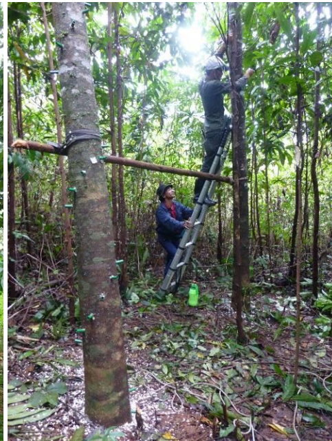
1 年間の実験プロジェクトのため、地元の自治体、住民、アガーウッドの所有者たちと、Thmo Don Pov 村と Reuseiy Chrum 村のコミュニティ林メンバーが参加して、薬の接種

エコツーリズム ：Tatay Lue 村の 3 つの地域の住民に向けて、Tatay Leu 村における CBET（コミュニティ主導型のエコツーリズム）と、委員会の体制についての説明会を開催し、86 名の住民（内女性 42 名）が参加しました。6 名の住民（内女性 5 名）が、8 名の委員会メンバーとともに、キリロム国立公園内の Chambok エコツーリズムに関するスタディーツアーに参加するために選ばれました。訪問中、Chambok エコツーリズムのチーフとそのメンバーから、エコツーリズムの管理、体制、歴史について学び、コミュニティ保護区と CBET の関係やその管理方法について学びました。その後、観光地を訪れ、ホームステイをし、料理やクメール民族の伝統的