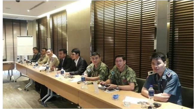
タイで開催された、野生生物不正取引調査と国境を越えた組織犯罪に関する研修に参加したレンジャーたち