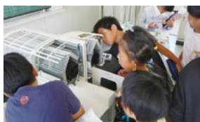
エアコンのしくみを考える理科授業

ダイキン工業は、堺市教育委員会が推進する「小学校理科特別授業実施事業」に賛同して、従業員が講師となる理科実験授業を実施しています。エアコンの熱の伝わり方と空気が冷えるしくみや、空気清浄機の電気集塵のしくみについて、