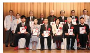
バウンティ贈呈式

大会に合わせて寄付金を募り、「オーキッドバウンティ」として、沖縄の芸術・文化・教育・スポーツなどの振興を図る個人・団体へ継続的に贈呈しています。