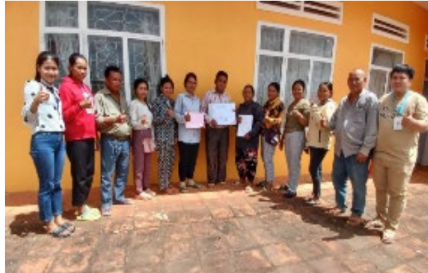
基金グループを対象とした会計管理研修

2024 年 6 月 19-20 日にかけては、基金グループの円滑な運営に向けて会計管理研修が行われ、11 人の運営メンバー（女性 8 人、男性 3 人）が参加しました。また、来年度にはトンレサッププログラムで実施されている基金グループへの視察訪問を計画しています。