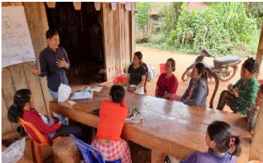
レモングラス生産者グループ向けの研修

また、プロジェクトからのサポートも伴って、レモングラスオイル生産者グループはこれまで 1 リットル当たり 120US ドルでオイルを仲買人に販売していたところ 1 、値段交渉を行って今年は 1 リットル当たり 150US ドルまで引き上げることに成功しました。