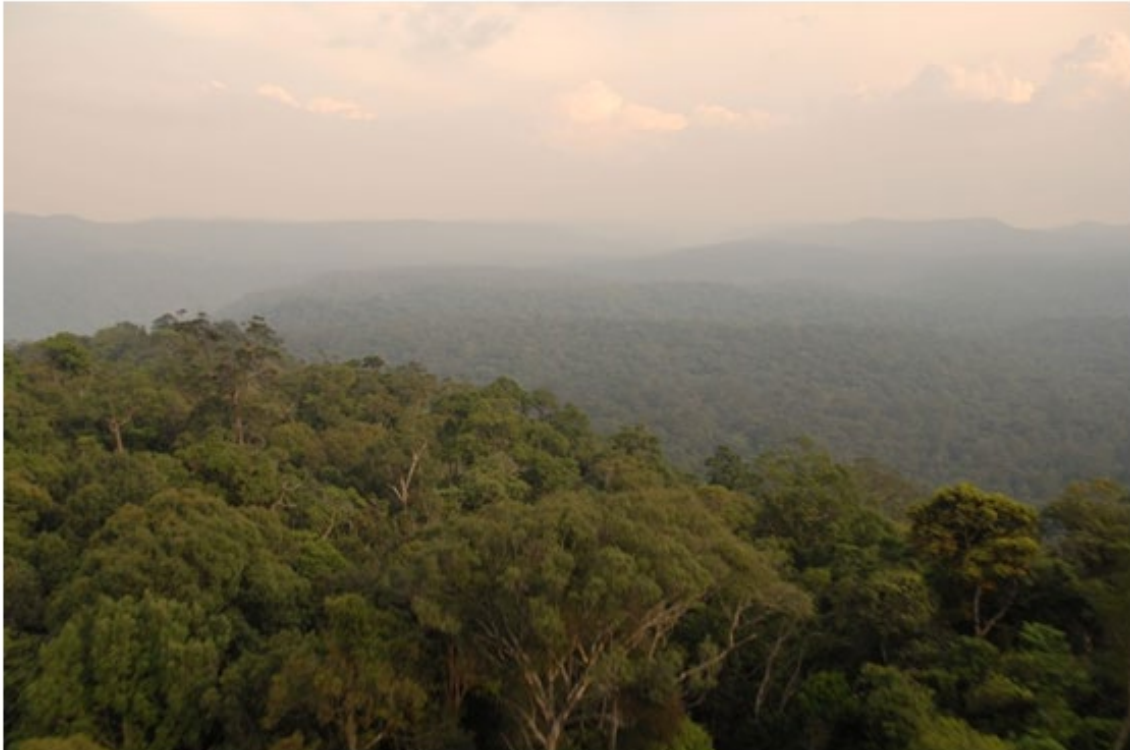
カルダモン山地の風景