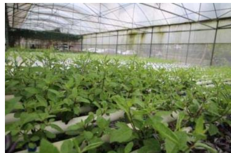
エコファーム視察