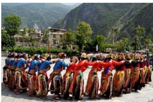
ガンブ村のボバダンス

ガンブ村は、チベット族の伝統的な村です。ガンブ村には無形文化財である、「ボバセンゲン（Boga Sengeng）」と呼ばれるユニークな踊りがあります。「ボバ」はチベット語で「人々」、「センゲン」は「ライオン」を意味します。この踊りは、中国最後の王朝である清朝時代に侵入者たちと戦った兵士を悼んだもので、19世紀の中頃にできたといわれており、100年以上にわたって受け継がれています。2008年に中国の無形文化財に登録されました。