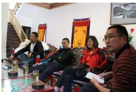
地元住民と政府との話し合い