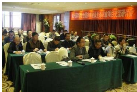
アグロフォレストリーワークショップ

2014年10月15日にアグロフォレストリー&エコフレンドリーワークショップを開催しました。研究所の専門家が来て、アグロフォレストリーの経験や、エコフレンドリー（＝環境にやさしい）農業の方法を話してくれました。四川省森林局、理県森林局、四川省の七つの自然保護区のリーダーたちや、私たちのプロジェクトサイトの住民たちも参加して、農業をすすめていく上での問題点などを話し合いました。