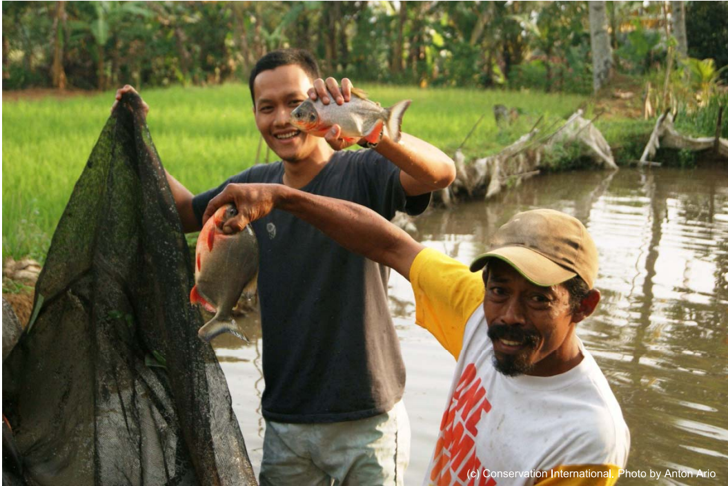
図 4. 淡水魚の養殖