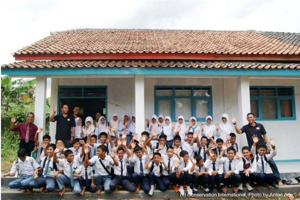
図 5. 移動環境教育の様子