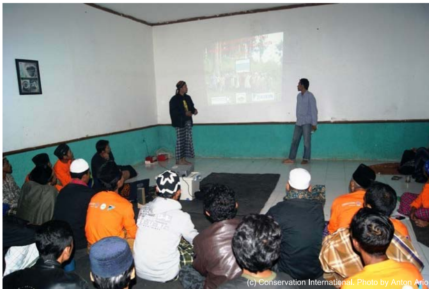
図 9. 参加農家代表者とのプロジェクト評価会

2012年8月、ポドゴール教育センターにおいて、プロジェクト参加農家の代表者達と、プロジェクトの評価と今後の計画作りについて話し合うための会合を開きました。