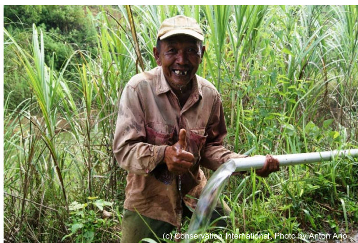
図 7. コミュニティに届けられた清潔な水

本年度、コミュニティからの強い要望を受け、人々が様々な機会に集う場であるモスクにも水供給システムを導入しました。