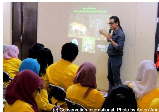
図 6. ドールと考えられている動物（左）とプロジェクト担当者による講義の様子（右）