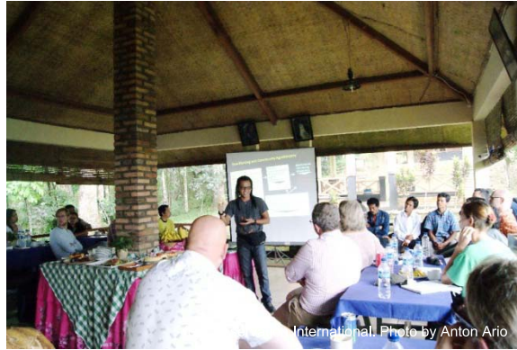
図 8. CIFOR とスウェーデン政府へのプレゼンテーション