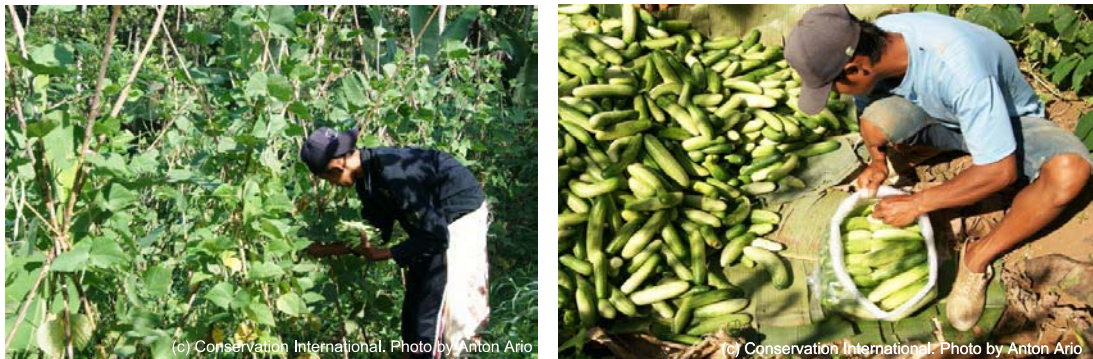
図 3. コミュニティ開発の様子（左：インゲンの栽培、右：キュウリの栽培）

コミュニティにとって、代替的な収入源は、国立公園への直接的な依存を低減させるために大変重要です。プロジェクトでは、様々な代替収入源の開発を通じて、コミュニティ開発・貧困削減に取り組んでいます。これまで実施してきた家畜（ヤギ）飼育支援、植林に使う苗の生産支援と買取に加え、2012 年度、国立公園の外でのコミュニティによる農業の支援と淡水魚養殖の導入を開始しました。農作物としては、市場で良い値がつくとして、ショウガ、インゲン、キュウリが農家によって選ばれ、インゲンとキュウリについては、すでに収穫が始まっています。また、淡水魚の養殖は、水という森林の恵みを人々に目に見える形で示し、森林に対する意識を高める上でも大変有効です。プロジェクトで設置した水源から水を運ぶパイプを使って、長年水が枯れていた養殖池に水を満たし、簡単な技術的指導を実施し、稚魚を放流しました。すでに大きく育った魚が市場に売られ、コミュニティに利益をもたらし始めています。