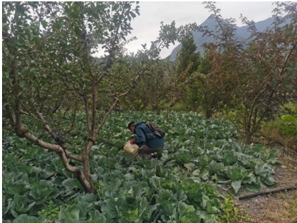
7. 土壌サンプル採集の様子