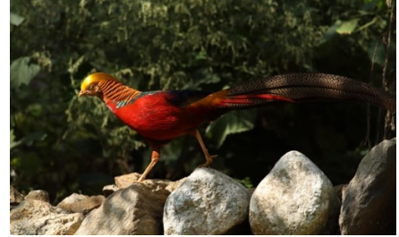
3. キンケイ ( Chrysolophus pictus )