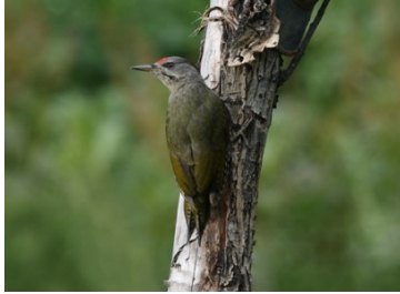
2. ヤマゲイ ( Picus canus )