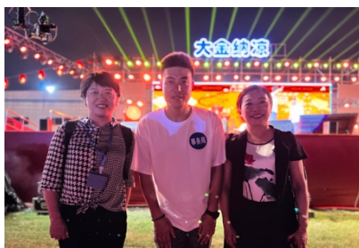
14. ダイキン、CI、YGE の代表