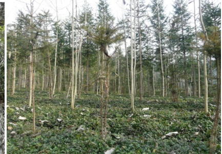
12. リアンヘ村 オウレン(漢方薬)を木の下に植え付ける様子