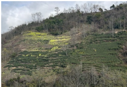
10. リジバ村の共有林 - 茶畑 -