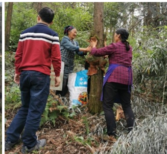
11. チャンフ村 石斛(せっこく、漢方薬)を木に巻き付ける様子