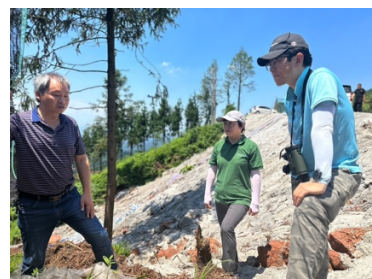
15. CI スタッフが洪雅県の現地パートナーを訪問