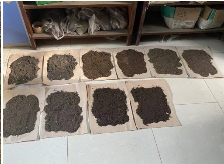
8. 土壌サンプルを乾燥する様子