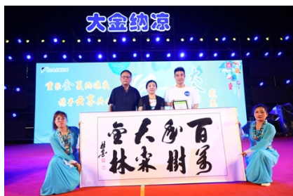
13. 植樹プロジェクト立ち上げの様子