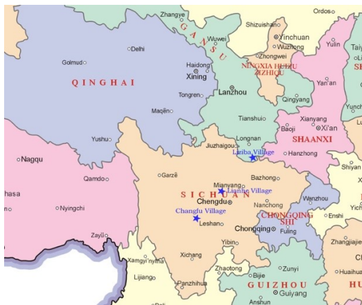
調査を実施した3つのサイト

2023年2月、中国科学院の森林生態学および森林管理の専門家と協力して、ガンブ村を対象に、中国西南部（四川省と甘肅省）におけるアグロフォレストリーを組み合わせた森林の共同管理の成功事例に関するケーススタディーを開始しました。