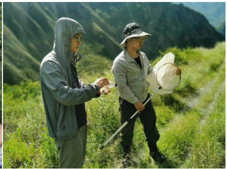
6. 昆虫モニタリングの様子