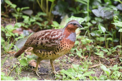
1. コジュケイ ( bambusicola thoracica )