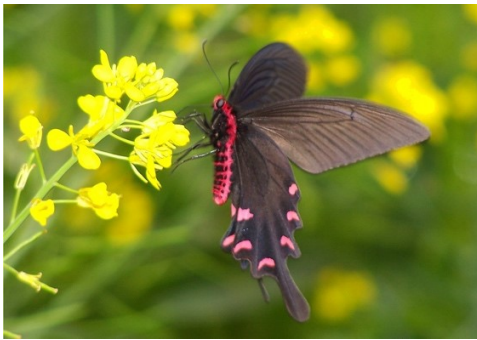
4. Byasa Menci (蝶の一種)