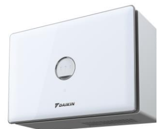
住まい向け除湿乾燥機『カライエ』

※3 室内温度27℃相対湿度60%を継続する室内で運転したときの1日あたりの水分量（排湿ホース長0.25m）。排気分の水分量含む。