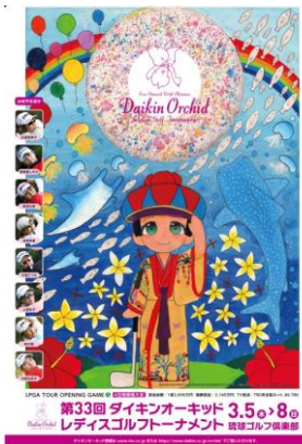
テーマ『夢をボールにのせて跳ばせ』

通常、陸上の絵を描くことが多いですが今回はあえて「海の中」を取り入れました。下(海中)から上(陸から空)に昇っていくように、「夢が叶うようゴルフボールに夢を詰めて夢に向かってどんどん上に飛んで行ってほしい」の願いを込めています。大会出場選手の皆さんには前向きな思い出で上へ、上へという気持ちで頑張ってもらいたいと思います。