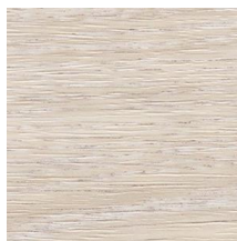
TC4359 チョークドオーク

特殊な印刷技術と緻密なエンボス加工で木目やレザーなどの素材のリアルな風合いを追求した(株)サンゲツの『REATEC』を『risora』に貼り付けることで、エアコンに陰影を持った深みのある表情を創出します。ナチュラルで健康的な空間づくりができる自然素材を再現した「グレーウォルナット」と「花染」を新たにラインアップ。自分らしく個性的な空間をつくるレザー、大理石、和紙など合計10種類のラインアップで過ごしたい空間づくりを実現します。