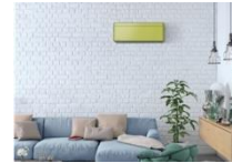
オリーブグリーン