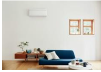
ファブリックホワイト