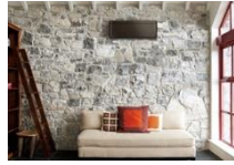
ウォルナットブラウン