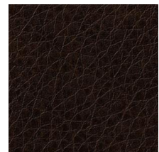
TC4515 レザー(ヴィンテージ)