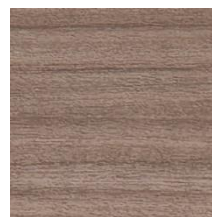
RW4062 グレーウォルナット