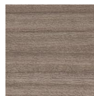
「グレーウォルナット」