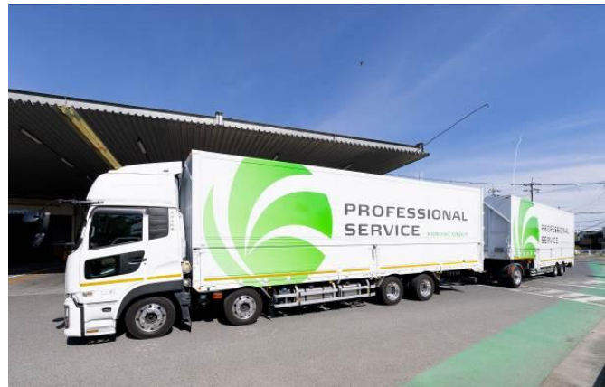
本スキームで運行するダブル連結トラック

ダイキン工業株式会社は、サントリーホールディングス株式会社（以下 サントリー）と共同で、ダブル連結トラック※を活用した新ルートでの往復輸送を、5月25日（月）より開始します。