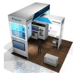
幅広い製品ラインアップやインバータ技術を紹介するダイキンブースのイメージ