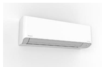
エアーコンディショナー 『FTKZ09VV2S』