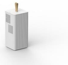
ポータブルエアコン 『Carrime (キャリミー)』