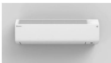
エアーコンディショナー 『CX/Cシリーズ』