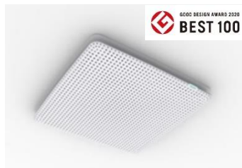
東南アジア向け 冷房専用カセットエアコン