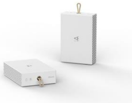
コードレス脱臭機 『LOOP STREAMER (ループストリーマ)』