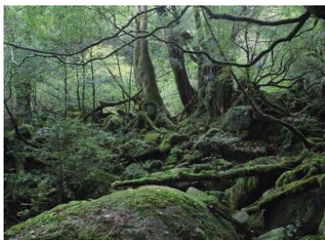
Aコース:屋久島「こちエコツアー」