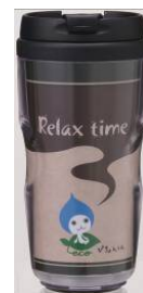
Bコース:こちエコグッズ「ぴちよんくんタンブラー」