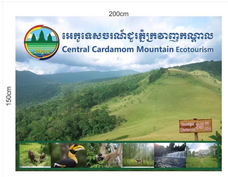
Tatai Leu 村のエコツーリズムの看板の例

Tatai Leu 村におけるエコツーリズムの開発はずいぶんすすみましたが、カンボジアではこの数ヶ月は雨季のため、観光客がほとんど訪れません。この期間を利用して、エコツーリズムを催行するコミュニティの体制の強化、レンタサイクル用の自転車の購入、インフラの改善をしました。ホームステイの施設や看板も完成しました。