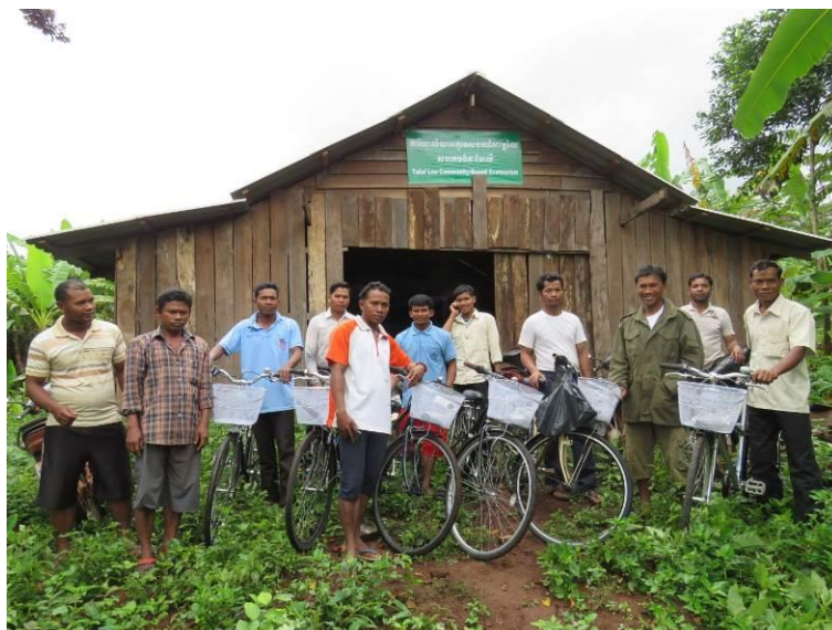
新しい自転車と、観光情報センターの前で