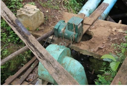
マイクロ水力発電ユニット