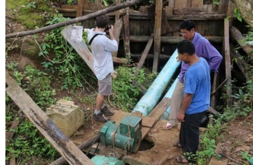
Tatoi Leu 村にて、マイクロ水力発電ユニットを調べる研究者