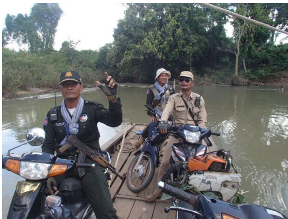
ロレックでパトロール中のレンジャー

監督省庁が森林局から環境省へ移行し、いつ、誰によってお給料が支払われるかも分からない中でも、レンジャーたちは保全のための取り組みを続けています。レンジャーたちの保全に対する献身的な姿勢に改めて気づかされました。