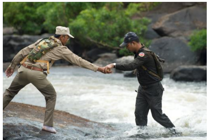
Thmr Bang におけるレンジャー

管理チームは定期的に打ち合わせをし、移行期間をどのようにやりくりするのが最善か、レンジャーたちの所属はどのように移行させるか、パトロールの継続方法、環境省との関係の強化方法などを話し合いました。ダイキンの支援により、コミュニティによるパトロールを継続させることができます。現在、絶滅の危険性が高いアロワナ（ドラゴンフィッシュ）とシャムワニに注力したパトロールを行なっています。