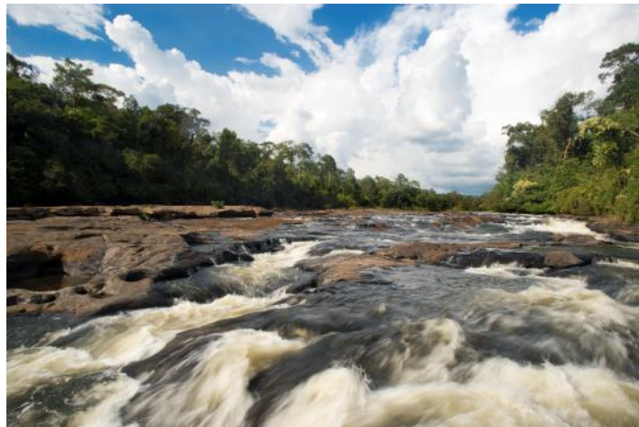
Tatai Leu を流れる Areng 川

Tatai Leu 村におけるエコツーリズムの立ち上げが順調に進んでいます。Tatai 川に面したエコロッジとの連携も拡大し、多くの宿泊客がプロジェクトサイトを訪れるようになってきました。Tatai Leu 村を訪れる多くのスタディーツアーもあり、コミュニティ内でのプロジェクトへの熱意も高まっています。レンタサイクルのための自転車も購入され、バードウォッチングやハイキングツアーも新たに作られました。