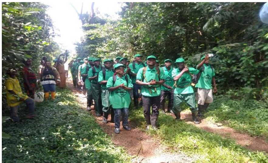
合同パトロールに出発するフロントライン保護官