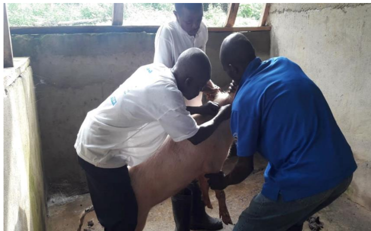
Glbayee 村で処置を受ける豚

また、26 人の豚の世話人が豚飼育専門家による実地トレーニングを受けました。正しい餌の混合と然るべきタイミングでの給餌は、豚の健康と成長に役立っています。