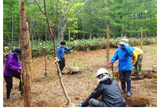
写真 1-2. 刈払ったササ地へ広葉樹中型苗を移植している様子 (2021年10月4日)