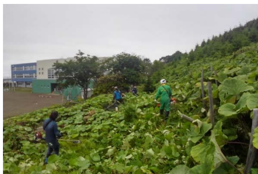
写真 2-10. 草刈りイベントの様子（八木浜町）