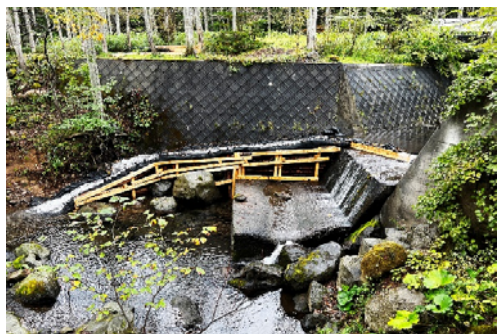
写真 1-7. 盤ノ川簡易魚道の完成状況 (2021年9月28日)