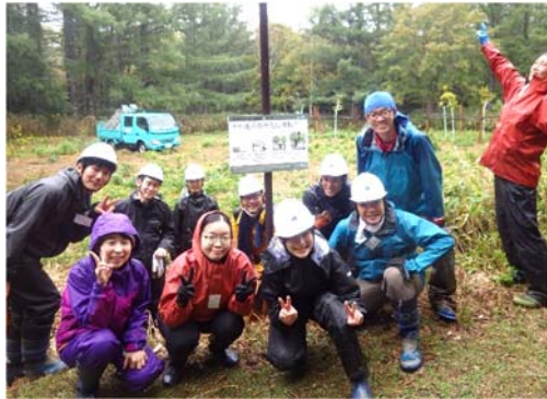
写真 1-3. ササ地の森林化の解説看板を設置 (2021年10月4日)