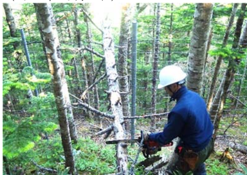
写真 1-5. 防鹿柵への掛かり木の除去作業の様子 (2021年6月10日)