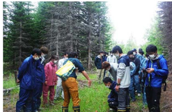
写真 2-6. 作業地を見学する東京農業大学 3 年生（2021 年 7 月 8 日）