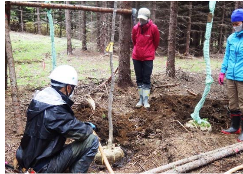
写真 1-4. アカエゾマツ造林地へ広葉樹中型苗を移植している様子 (2021年5月17日)