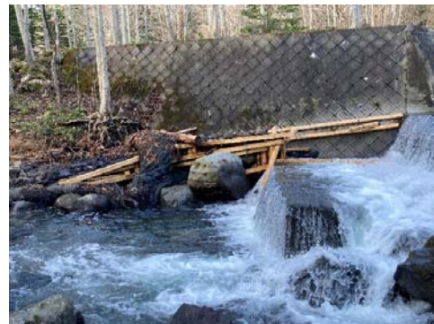
写真 1-8. 盤ノ川簡易魚道の破損状況 (2021年11月11日)