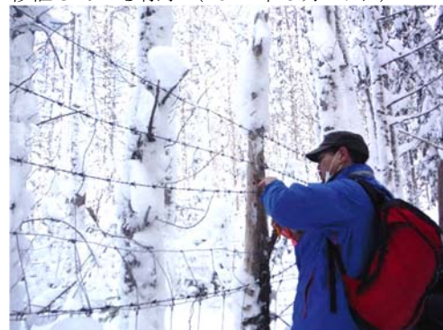
写真 1-6. 防鹿柵の補修作業の様子 (2022年2月29日)