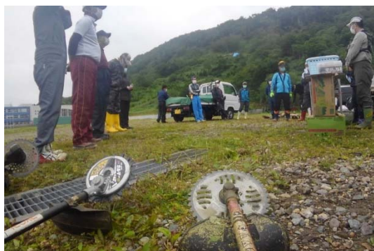
写真 2-9. 草刈りイベント開始時ミーティング

町内会活動をサポートする形で 2019 年から実施している「草刈りイベント」は、羅臼町役場からの職員参加があっただけでなく、町内への呼びかけにも役場の方々に協力いただき、活動が町内全域に広がっていきました。また 2020 年からは町内建設業者等の参加もあり、ヒグマ対策への「輪」がさらに広がりつつあります。参加地区・のべ人数は、2019 年に 2 地区 12 名、2020 年に 11 地区 179 名、2021 年に 10 地区 157 名となっています。町民と共に汗をかくことで、ヒグマ対策への考え方を共有しているようにも感じ、作業後は充実した気持ちを得ることができ、また、寄付事業の長年にわたる継続により、私たちのヒグマに対する取り組みへの理解が少しずつですが町民へ浸透してきていることを実感しています