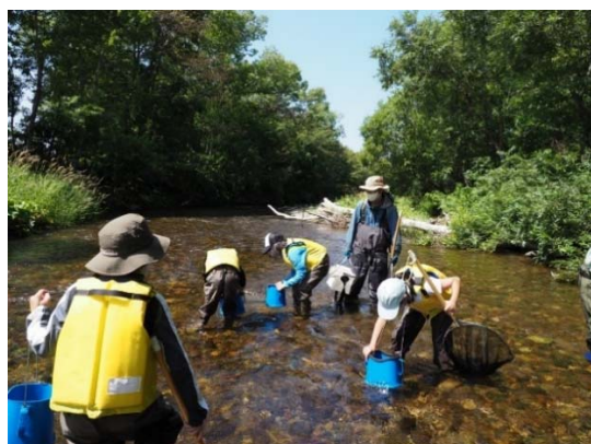
写真 2-1. 知床博物館キッズの「川の生き物観察会」の様子

かつてあった知床の森の姿や開拓の歴史、現在行われている森づくりについて広く一般の方に伝えるための絵本製作プロジェクトが2020年から2か年計画で始動し、今年度3月、ついに絵本「みずならがはなしてくれたこと」が完成しました。絵本の巻末には、知床の森づくりの現場や100平方メートル運動の歴史をイラストや図表でわかりやすく解説したページなどを組み込み、本体のストーリーだけではなく、知床の森づくりの背景も伝える内容の一冊としました。奥付には寄付金による製作支援についても記載しました。