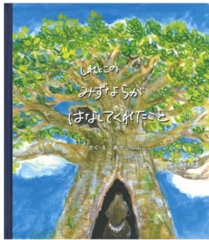
写真 2-3. 絵本「みずならがはなしてくれたこと」の表紙画像