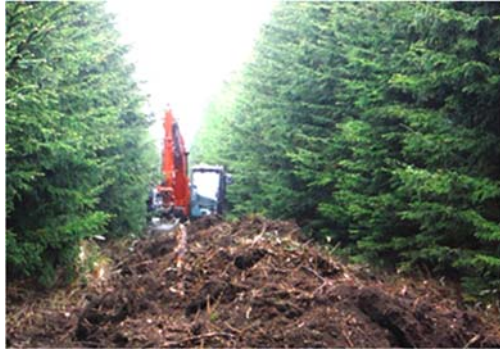
写真 1-1. 重機を用いたササ地の掻き起こし作業 (2021年6月8日)