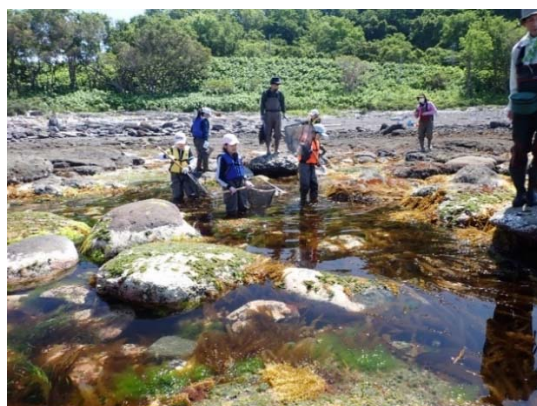
写真 2-2. 斜里町立知床ウトロ学校3年生の総合学習「チャシコツ磯の生き物観察学習」