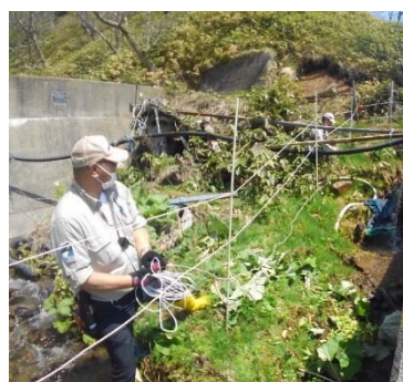
写真 2-8. 電気柵の立ち上げ作業の様子