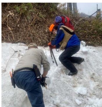
写真 2-7. 電気柵の立ち上げ作業の様子

電圧チェックは日常的に行い、低下していた場合には直ちに修繕、バッテリー交換といった維持管理作業を行いました。また、市街地中心に設置している電気柵については、2020年度導入の遠隔電圧監視システムの運用により、パソコンや携帯電話で随時通電状況の確認を行いました。さらに、繁茂した草本がラインに接触しないよう草刈りについても必要に応じて行い、一部省力化のため除草剤を活用しました。