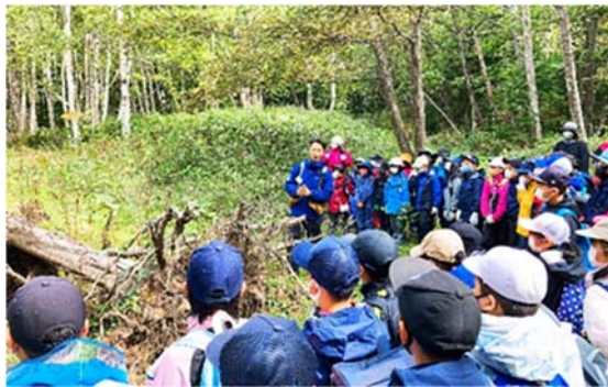
写真 2-5. 開拓小屋コースを散策する斜里小学校 4 年生（2021 年 9 月 10 日）

コロナ禍が続く中、学校での出前授業や、実際に現地にて開拓の歴史や運動の歩みを学ぶ授業を可能な限り行いました。知床ウトロ学校 4 年生および斜里小学校 4 年生、斜里高校 1 年生の授業では、当事者意識を育てる目的で植樹作業を行いました。また、東京農業大学オホーツクキャンパスの学生実習を受け入れ、森林生態学の研究者を目指す学生に対して実践的な学びの場を提供しました（写真 2-5,2-6）。